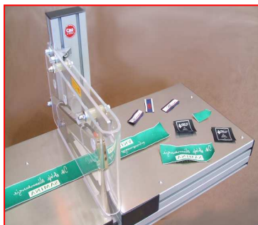
piano di lavoro