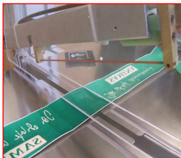
lama di taglio